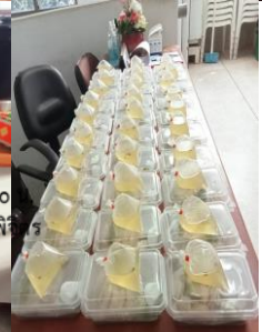
วันจันทร์ที่ ๑๖ กุมภาพันธ์ ๒๕๖๙ เวลา ๐๙.๐๐-๑๖.๓๐ น. ณ ห้องประชุมสำนักงานสาธารณสุขอำเภอสากเหล็ก จังหวัดพิจิตร